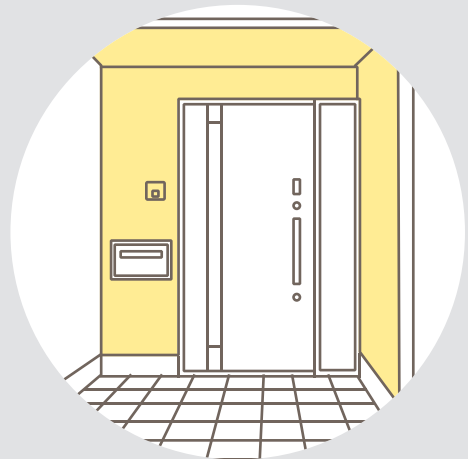
玄関廻りの壁面 ・ 軒天面