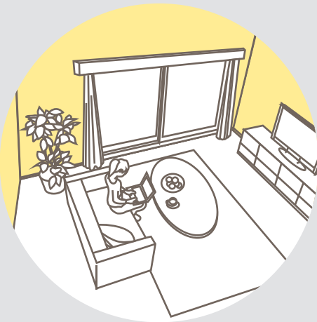
室内壁面 各種塗装 ビニールクロス面